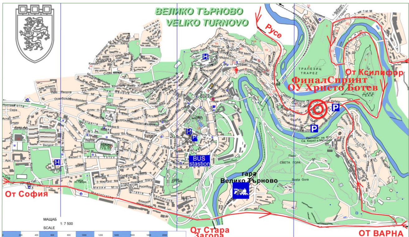
Схема - Спринт

Моля паркирайте на обозначените на схемата места.