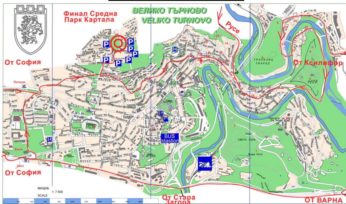
Схема – Средна дистанция

Моля, паркирайте на обозначените на схемата места.