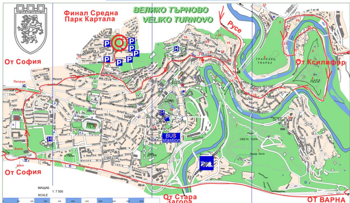
Схема – Средна дистанция

Моля, паркирайте на обозначените на схемата места.